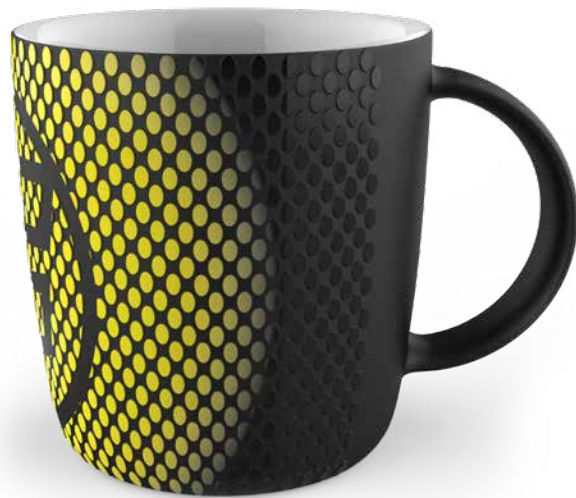
Tasse mit 3D-Druck veredelt