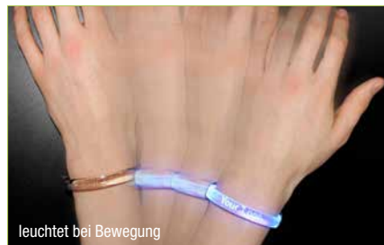
leuchtet bei Bewegung