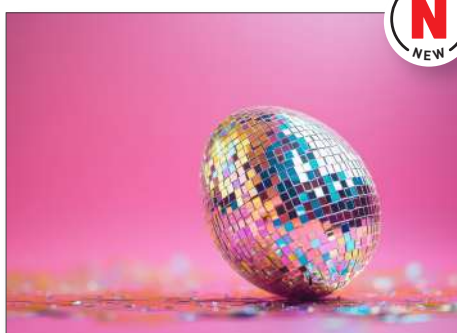
220125 Disco Ei