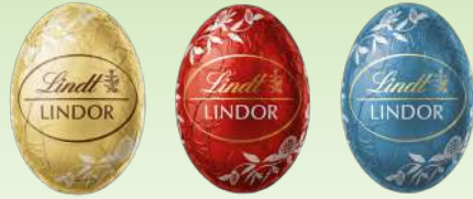
Weiß Milch Doppelmilch