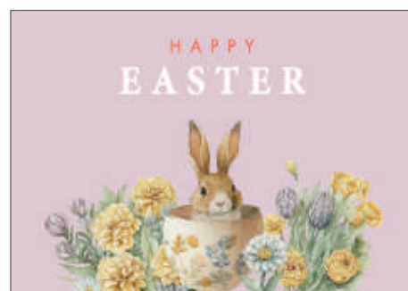
219168 Retro Easter Pink