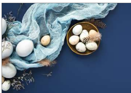
219165 Edle Ostereier