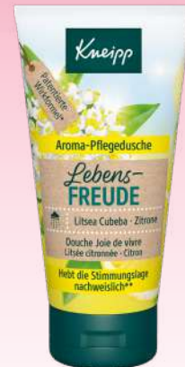
Litsea Cubeba & Zitrone