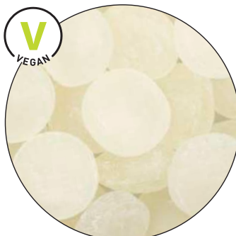
Cavendish & Harvey Japanische Minze