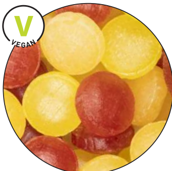
Cavendish & Harvey Fruchtmix (Himbeere, Zitrone, Pfirsich)