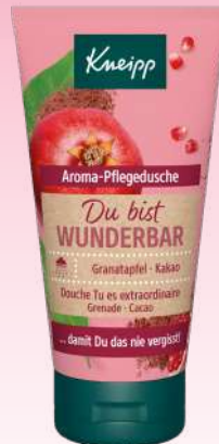
Granatapfel & Kakao