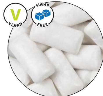
KoRo Menthol Kaugummi