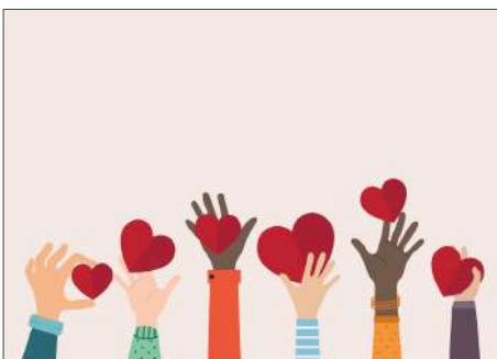
218936 Hände mit Herzen