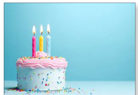
219163 Bunter Kuchen