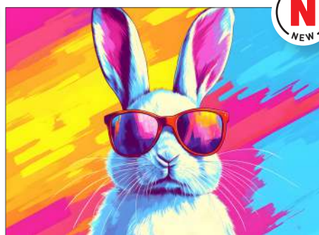
220126 Farbparty Osterhase