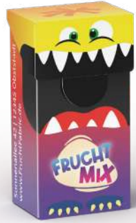
Slim Box Mini