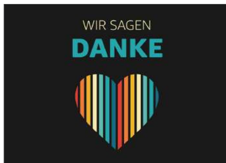
218944 Wir sagen danke