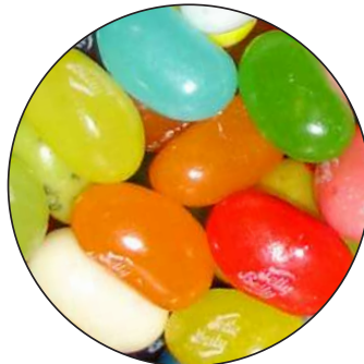
American Style Jelly Beans