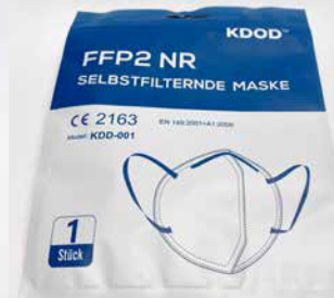
einzel hygienisch verpackt