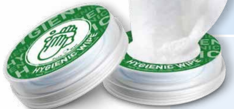
Standardmotiv (kann ab 10.000 Stück individuell gestaltet werden)