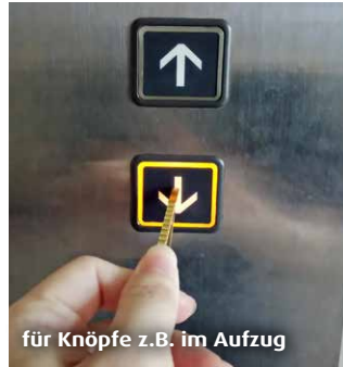
für Knöpfe z.B. im Aufzug