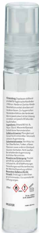
Rückseite mit gesetzlichen Angaben