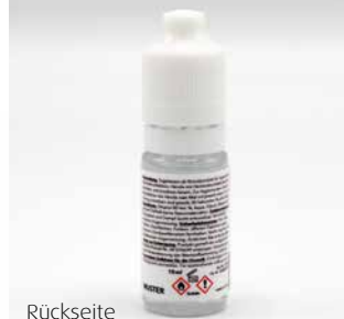
Rückseite mit gesetzlichen Angaben