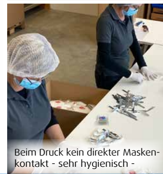
Beim Druck kein direkter Maskenkontakt - sehr hygienisch -