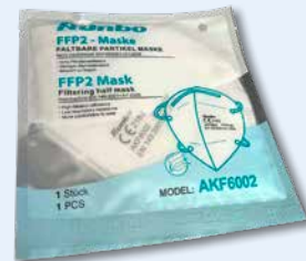
jede Maske ist einzeln verpackt