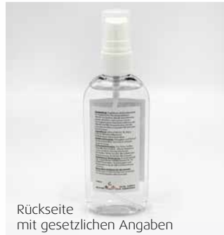
Rückseite mit gesetzlichen Angaben