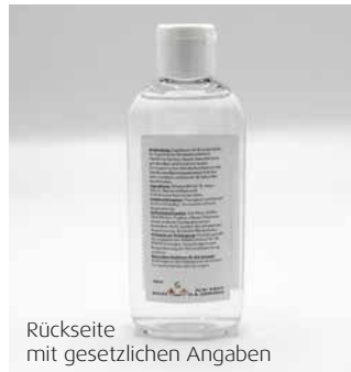
Rückseite mit gesetzlichen Angaben