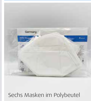
Sechs Masken im Polybeutel