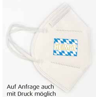
Auf Anfrage auch mit Druck möglich