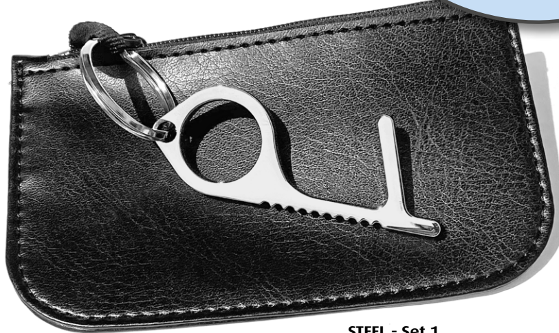
STEEL - Set 1 schwarzes PU-Kunstlederetui mit Metall Non-Touch Tool STEEL