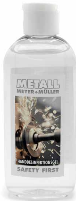
MAXI GEL 100 ml