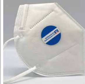
Etikett auch in rund möglich