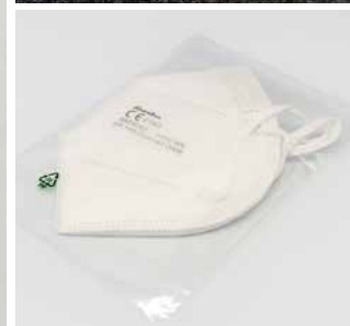
einzel im Polybeutel € 0,14