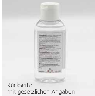
Rückseite mit gesetzlichen Angaben