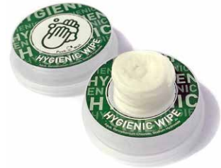
mit vier CleanX Handdesinfektionstüchern