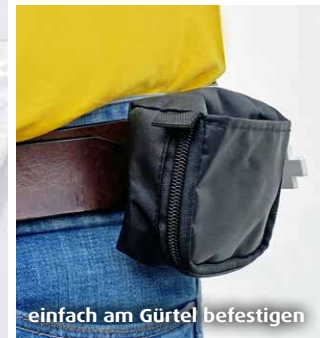
einfach am Gürtel befestigen