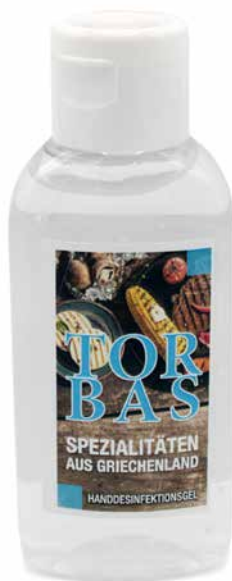
MINI GEL 50 ml