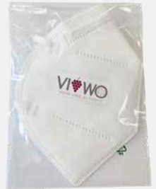
einzel im Polybeutel