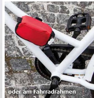
oder am Fahrradrahmen