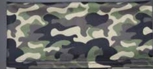
Als Stirnband verwendbar

Jetzt noch günstiger und noch schneller geliefert!