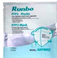
einzel hygienisch verpackt