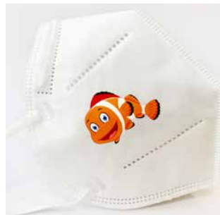
gestochen scharfe Darstellung