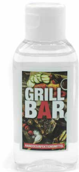
MINI FLUID 50ml