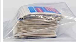
einzeln geschnitten und zu 100 Stück im Polybeutel verpackt