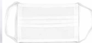
mit wiederverwendbarer Baumwollmaske SAFEPLAN