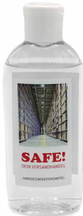
MAXI FLUID 100ml