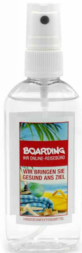
MAXI SPRAY 100 ml