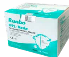
20 Stück im Innerkarton