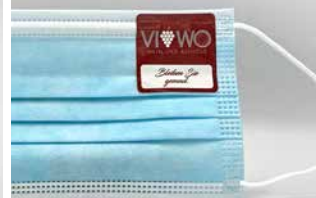
Für alle Masken-Typen geeignet