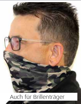
Auch für Brillenträger