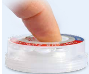
Tuch & Desinfektionsflüssigkeit getrennt in PP5 Behälter