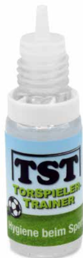
MICRO FLUID mit Pipette