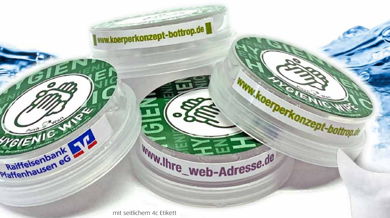
mit seitlichem 4c Etikett