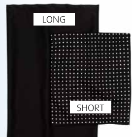
In zwei Größen verfügbar