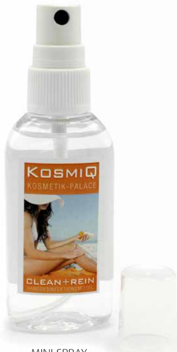
MINI SPRAY 50 ml