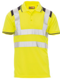
GUARD+ ITEM CODE 001028-0028 COLOR CODE 01014