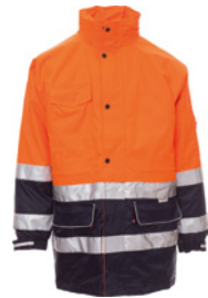
SECURITY ITEM CODE 000350-0093 COLOR CODE 02011