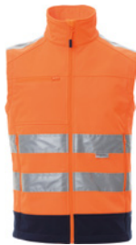
TRAFFIC ITEM CODE 001449-0090 COLOR CODE 02011