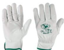
50/55TOP ITEM CODE 000496-0143 COLOR CODE 99003