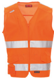
EXPERT ITEM CODE 000335-0088 COLOR CODE 02001