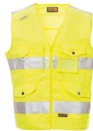
MASTER ITEM CODE 000333-0087 COLOR CODE 01006