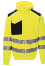
LEADER ITEM CODE 001457-0439 COLOR CODE 01014