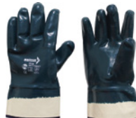
TFCB ITEM CODE 000626-0124 COLOR CODE 08000