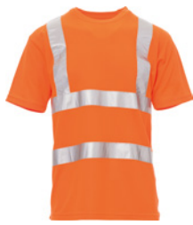
AVENUE ITEM CODE 000342-0028 COLOR CODE 02001