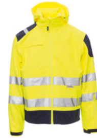
SHINE ITEM CODE 000343-0090 COLOR CODE 01014