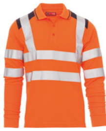
GUARD+ WINTER ITEM CODE 001077-0028 COLOR CODE 02011