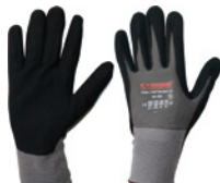
01-101 ITEM CODE 001476-0457 COLOR CODE 13014