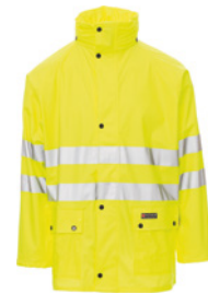
RIVER-JACKET ITEM CODE 000352-0094 COLOR CODE 01006