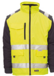
HIWAY ITEM CODE 000346-0091 COLOR CODE 01014