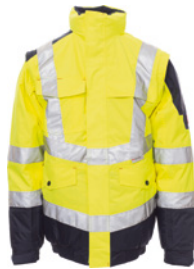
INTERSTATE ITEM CODE 000440-0106 COLOR CODE 01014