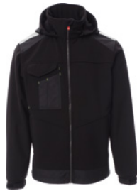
PERFORMER 2.0 ITEM CODE 001473-0053 COLOR CODE 14018