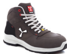
GET FORCE MID ITEM CODE 001445-0414 NBK COLOR CODE 50000