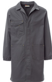
SHELL ITEM CODE 001266-0331 COLOR CODE 13007