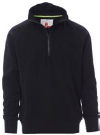
AUSTIN ITEM CODE 001380-0412 COLOR CODE 14000