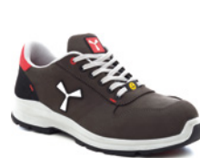
GET FORCE LOW ITEM CODE 001467-0414 NBK COLOR CODE 51002