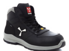
GET FORCE MID ITEM CODE 001445-0414 LTH COLOR CODE 50001