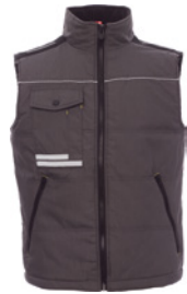
AZUA 2.0 ITEM CODE 001032-0050 COLOR CODE 13007