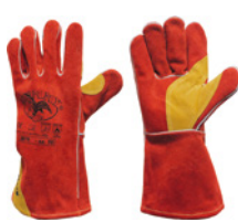
307R ITEM CODE 000508-0160 COLOR CODE 03000