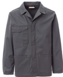
WING ITEM CODE 001264-0331 COLOR CODE 13007