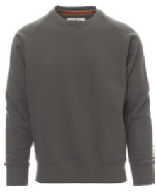
MISTRAL+ ITEM CODE 000004-0001 COLOR CODE 13007