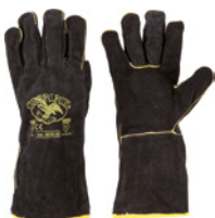
307G ITEM CODE 000507-0160 COLOR CODE 14000