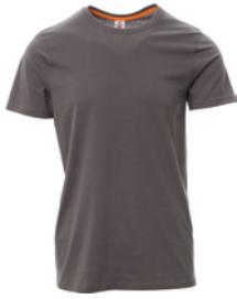
SUNSET ITEM CODE 000101-0030 COLOR CODE 13007