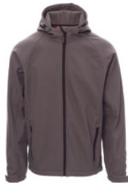
GALE ITEM CODE 001044-0355 COLOR CODE 13008