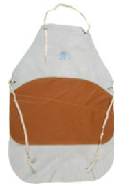
303P ITEM CODE 000563-0149 COLOR CODE 99003