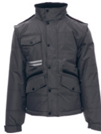
FIGHTER 2.0 ITEM CODE 001012-0051 COLOR CODE 13010