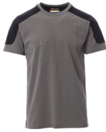
CORPORATE ITEM CODE 001464-0438 COLOR CODE 13010