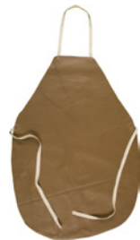
303 ITEM CODE 000560-0152 COLOR CODE 99000