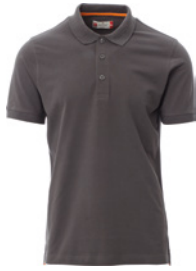
VENICE ITEM CODE 000907-0305 COLOR CODE 13007