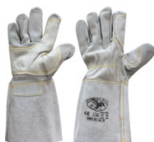
250T-15 ITEM CODE 000513-0160 COLOR CODE 99003