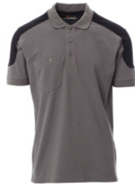
COMPANY ITEM CODE 001465-0440 COLOR CODE 13010