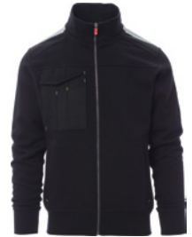
WORK 2.0 ITEM CODE 001382-0001 COLOR CODE 14000