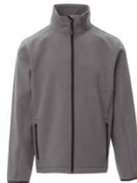
PERTH ITEM CODE 001474-0491 COLOR CODE 13008