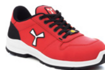
GET FORCE LOW ITEM CODE 001467-0414 NBK COLOR CODE S3000