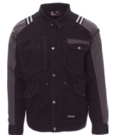
ARIZONA ITEM CODE 000319-0064 COLOR CODE 14025