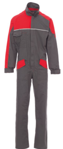
PROMOTECH ITEM CODE 000961-0340 COLOR CODE 13041