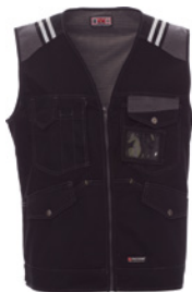
TUCSON ITEM CODE 000317-0064 COLOR CODE 14025