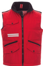
MIG 2.0 ITEM CODE 001011-0051 COLOR CODE 02012