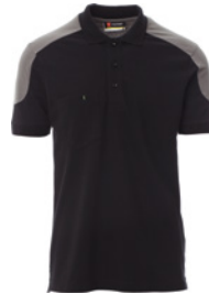
COMPANY ITEM CODE 001465-0440 COLOR CODE 14025