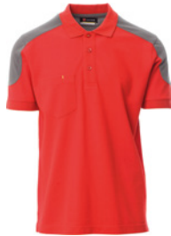
COMPANY ITEM CODE 001465-0440 COLOR CODE 03021