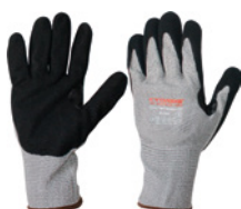
01-301 ITEM CODE 001477-0458 COLOR CODE 13014