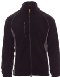
ASPEN+ ITEM CODE 001004-0069 COLOR CODE 14023