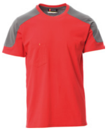
CORPORATE ITEM CODE 001464-0438 COLOR CODE 03021