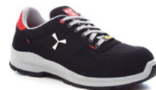
GET TEXFORCE LOW ITEM CODE 001481-0464 SUT COLOR CODE S0005