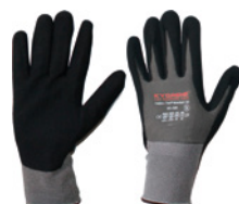
01-101 ITEM CODE 001476-0457 COLOR CODE 13014