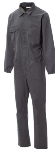
COVER ITEM CODE 001262-0331 COLOR CODE 13007