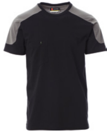
CORPORATE ITEM CODE 001464-0438 COLOR CODE 14025