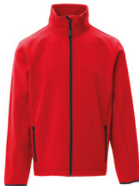
PERTH ITEM CODE 001474-0491 COLOR CODE 03000