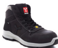
GET FORCE MID ITEM CODE 001445-0414 NBK COLOR CODE S0000