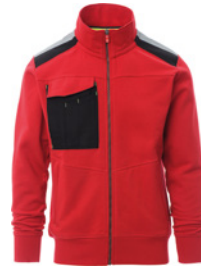
WORK 2.0 ITEM CODE 001382-0001 COLOR CODE 03000