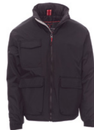
RENEGADE ITEM CODE 000871-0051 COLOR CODE 14023