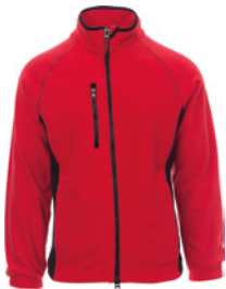
ASPEN+ ITEM CODE 001004-0069 COLOR CODE 03015