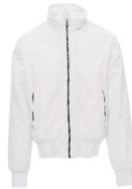
NORTH 2.0 ITEM CODE 001013-0343 COLOR CODE 00000