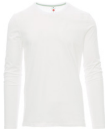
PINETA ITEM CODE 000893-0033 COLOR CODE 00000