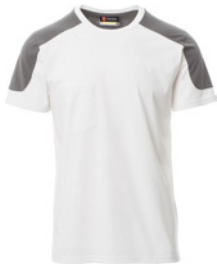
CORPORATE ITEM CODE 001464-0438 COLOR CODE 00029