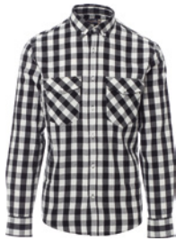
LABRADOR ITEM CODE 001355-0402 COLOR CODE 16002