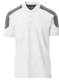
COMPANY ITEM CODE 001465-0440 COLOR CODE 00029