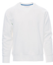
MISTRAL+ ITEM CODE 000004-0001 COLOR CODE 00000