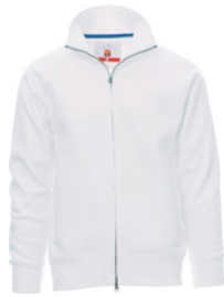
PANAMA+ ITEM CODE 000005-0001 COLOR CODE 00000