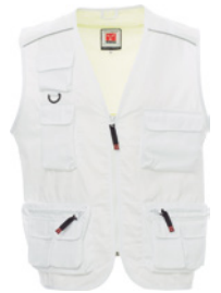
POCKET ITEM CODE 000187-0054 COLOR CODE 00000