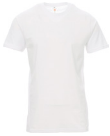
PRINT ITEM CODE 001048-0311 COLOR CODE 00000