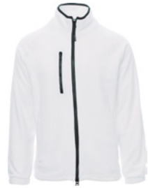
NORWAY ITEM CODE 000434-0069 COLOR CODE 00000