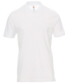
ROME ITEM CODE 001147-0373 COLOR CODE 00000