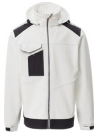
PERFORMER 2.0 ITEM CODE 001473-0053 COLOR CODE 00011