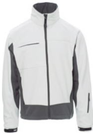
STORM ITEM CODE 000215-0053 COLOR CODE 00006