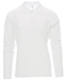
VERONA ITEM CODE 001213-0373 COLOR CODE 00000