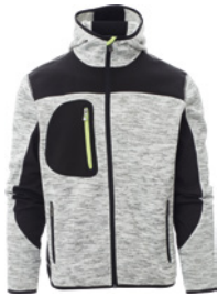
TRIP ITEM CODE 000453-0103 COLOR CODE 01021