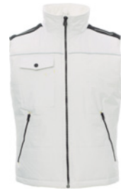
AIRSPACE 2.0 ITEM CODE 001029-0049 COLOR CODE 00000