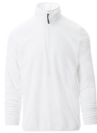
SOFT+ ITEM CODE 001294-0070 COLOR CODE 00000