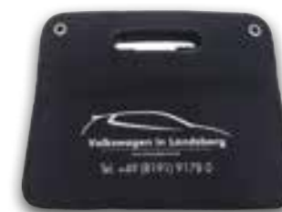
ein- oder mehrfarbig individuell bedruckbar