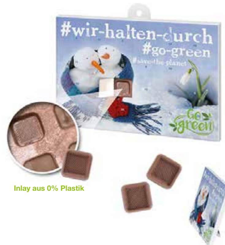
Inlay aus 0% Plastik

Drucknebenkosten: pauschal € 129,00 Datenbearbeitung: falls Sie Druckdaten nicht 1:1 anliefern können, nach Aufwand zu Selbstkosten