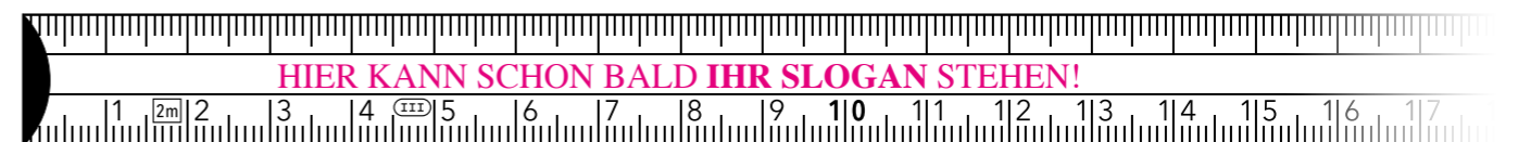
Zollstock mit freier Mittelleiste