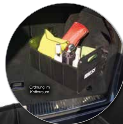
Ordnung im Kofferraum