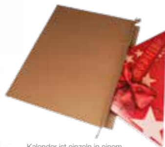
Kalender ist einzeln in einem im Versandkarton verpackt.