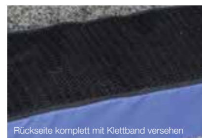
Rückseite komplett mit Klettband versehen