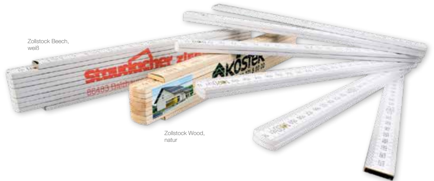
Zollstock Beech, weiß