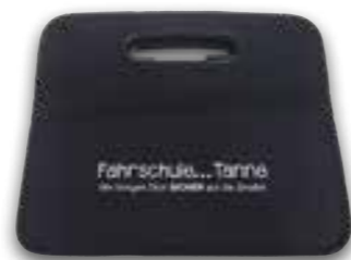
ein- oder mehrfarbig individuell bedruckbar