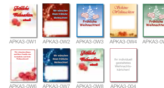
APKA3-0W1 APKA3-0W2 APKA3-0W3 APKA3-0W4 APKA3-0W5 APKA3-0W6 APKA3-0W7 APKA3-0W8 APKA3-004

Bitte bei Bestellung gewünschte Motiv-Nummer angeben: