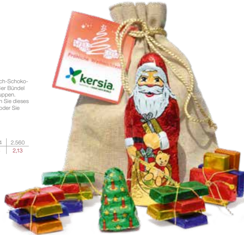
Weihnachtskärtchen - Bitte bei Bestellung gewünschte Motiv-Nummer angeben:

Drucknebenkosten: PKA1-DVK € 69,00 für Karte