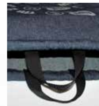
zwei zusätzliche Trageschlaufen