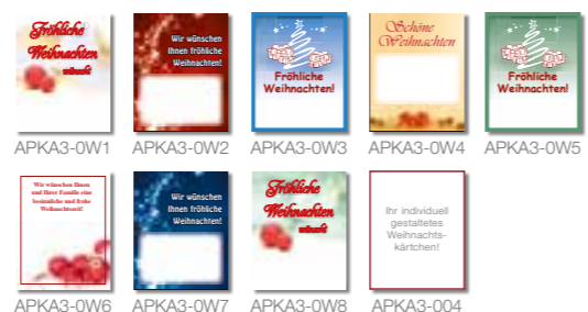
APKA3-0W1 APKA3-0W2 APKA3-0W3 APKA3-0W4 APKA3-0W5 APKA3-0W6 APKA3-0W7 APKA3-0W8 APKA3-004

Bitte bei Bestellung gewünschte Motiv-Nummer angeben: