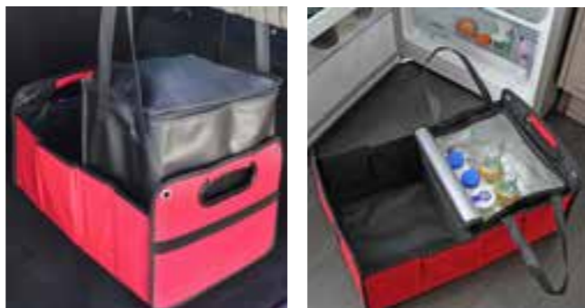
kompatibel mit der Flexbox und dem Car-Organizer, perfekt für Ihren Einkauf