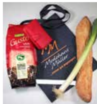
perfekt für den Einkauf