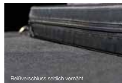
Reißverschluss seitlich vernäht