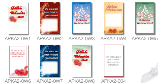
APKA2-0W1 APKA2-0W2 APKA2-0W3 APKA2-0W4 APKA2-0W5 APKA2-0W6 APKA2-0W7 APKA2-0W8 APKA2-004

Bitte bei Bestellung gewünschte Motiv-Nummer angeben: