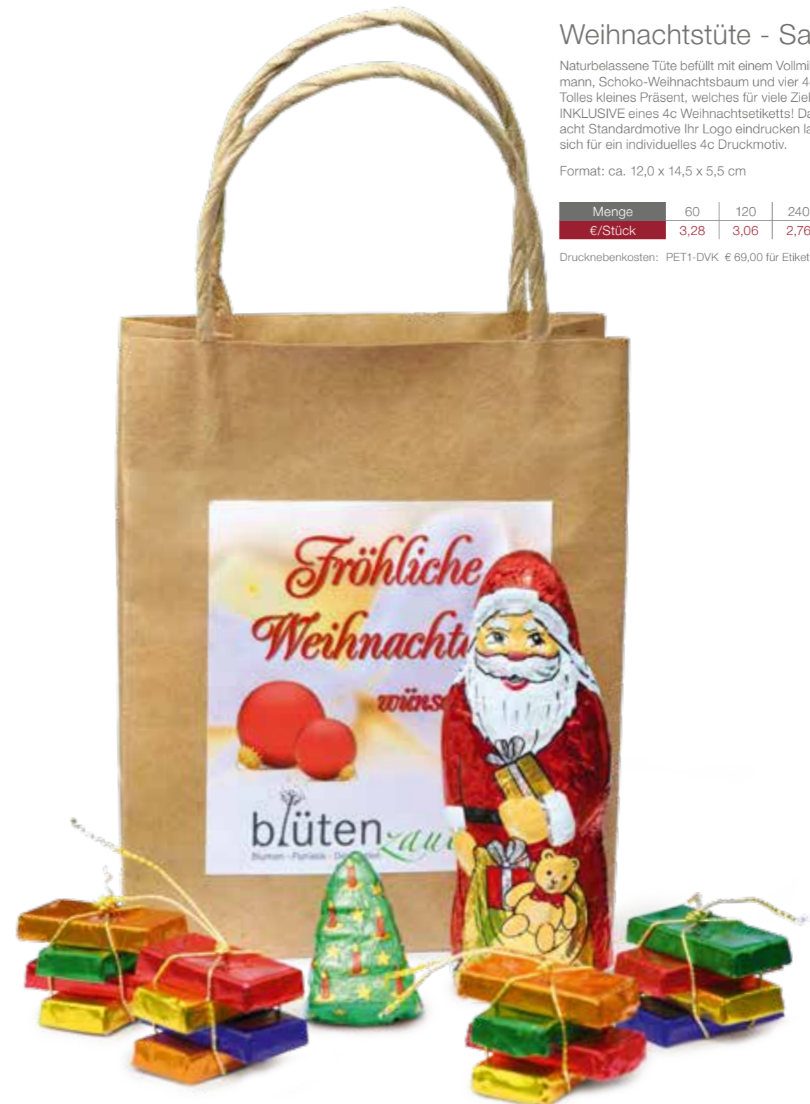
Weihnachtsetiketten - Bitte bei Bestellung gewünschte Motiv-Nummer angeben:

Drucknebenkosten: PET1-DVK € 69,00 für Etikett