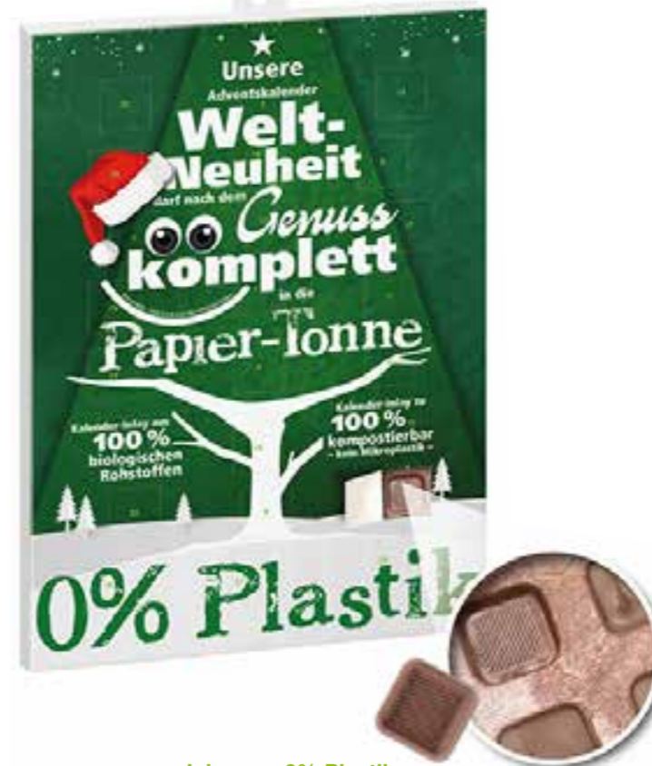
Inlay aus 0% Plastik