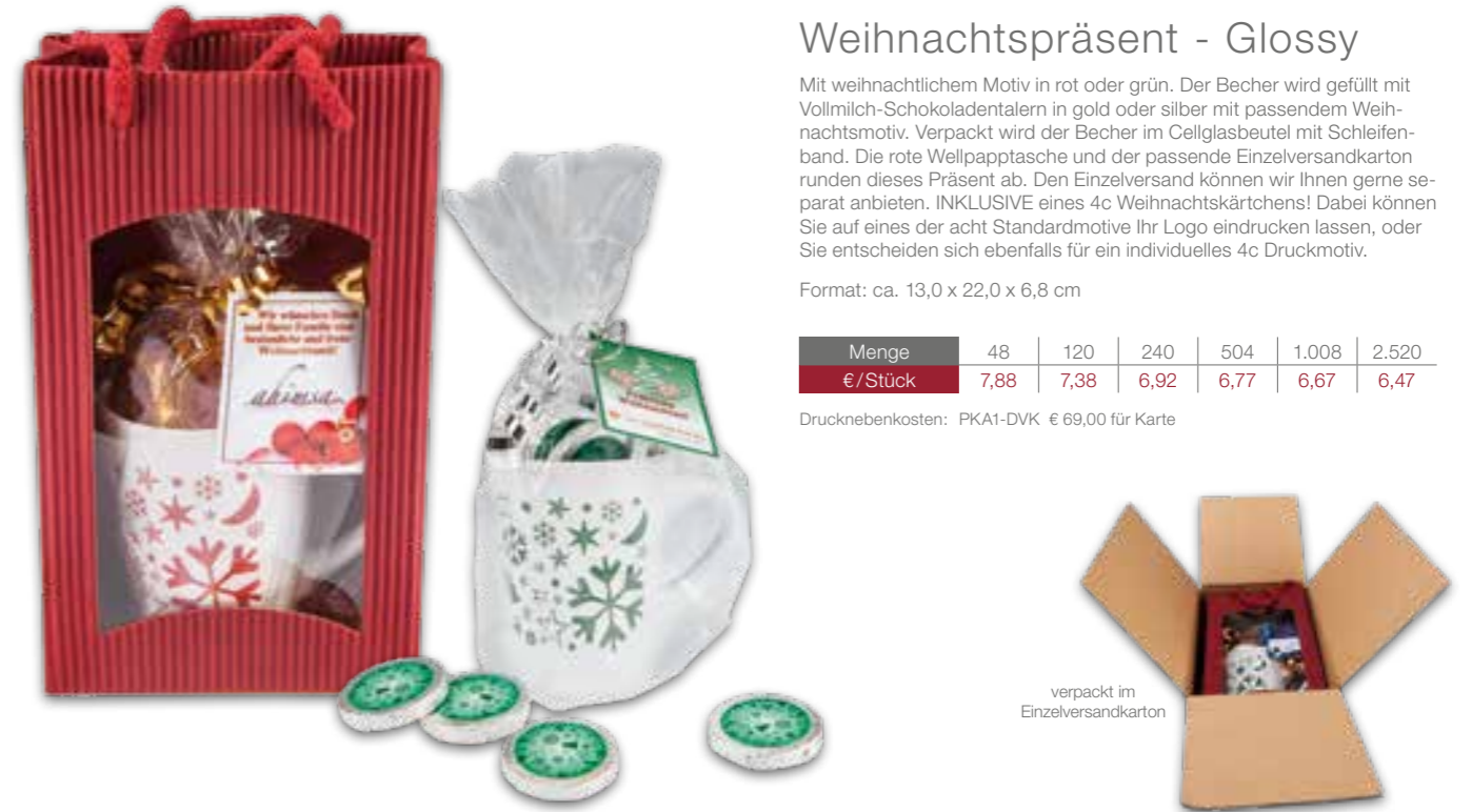
verpackt im Einzelversandkarton

Drucknebenkosten: PKA1-DVK € 69,00 für Karte