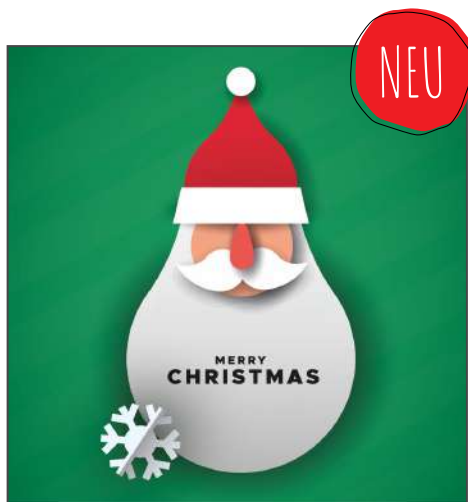
215865 – Weihnachtsmann mit Schneeflocken