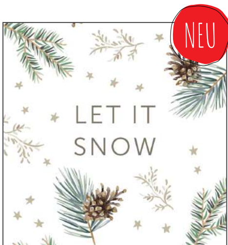
215851 – Let it snow