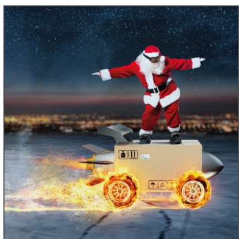
213585 – Crazy Santa