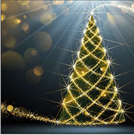
212993 – Der Weihnachtsbaum