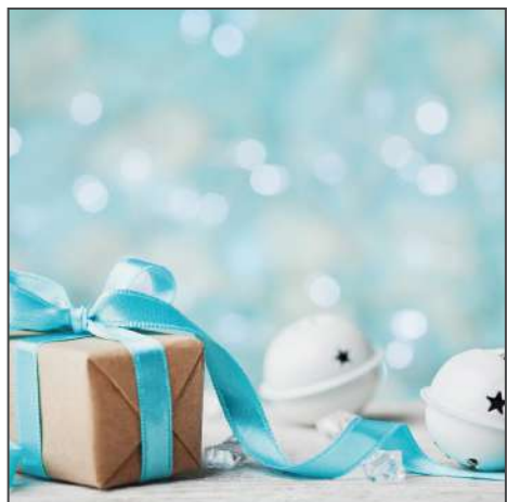
211207 – Glöckchen