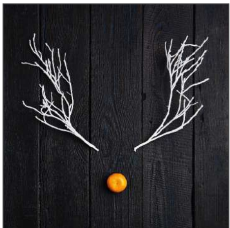
211059 – Geweih