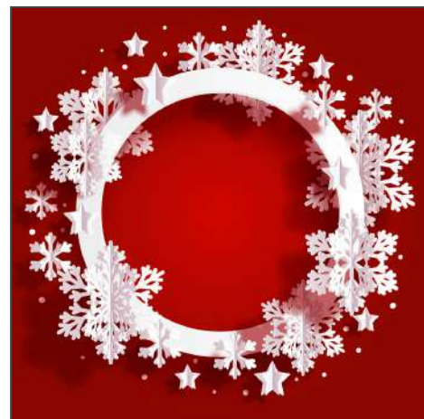
213576 – Schneeflocken