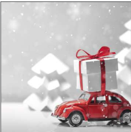
211196 – Auto im Schnee