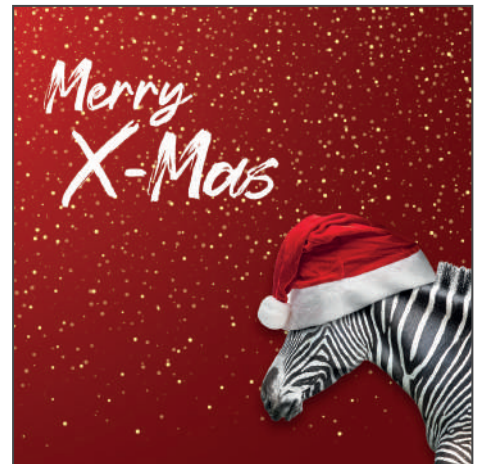
216031 – Weihnachts Zebra