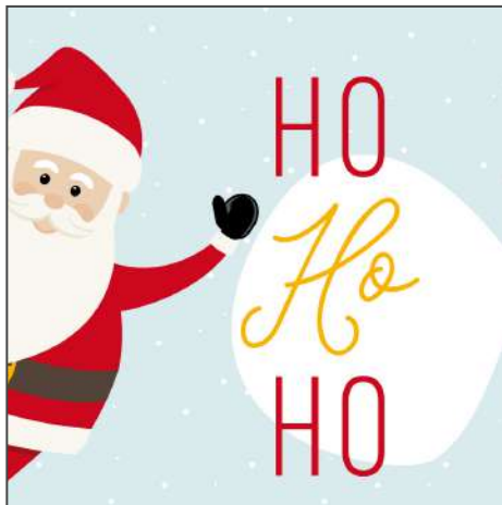
2113578 – Happy Santa