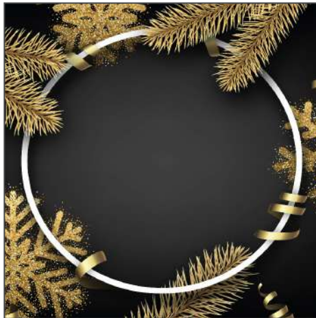
211195 – Edle Weihnachten