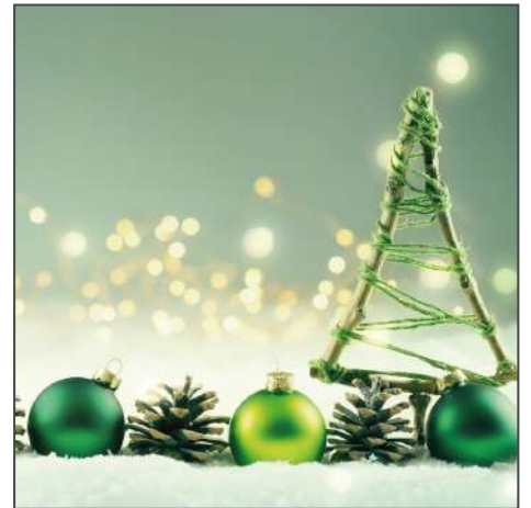
211200 – Grüne Weihnacht