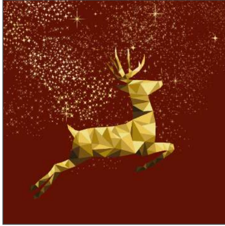
211080 – Rentier, Gold