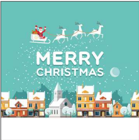
212990 – Christmas City