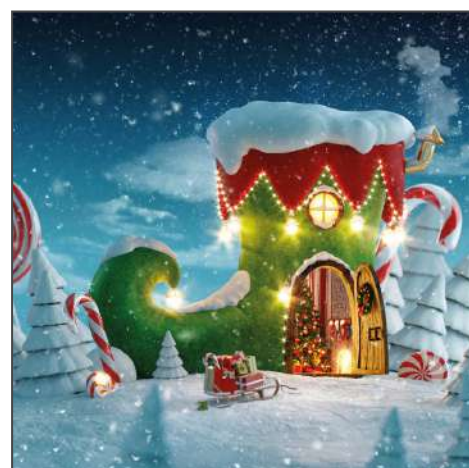
211208 – Winter Wonderland