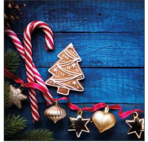
211204 – Weihnachtsdeko mit Zuckerstangen