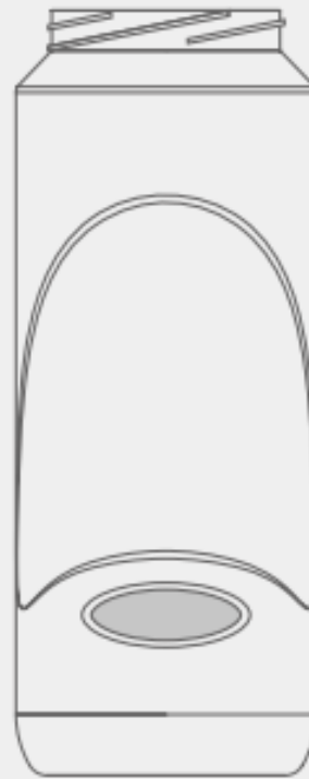
B2 – Gravuransicht