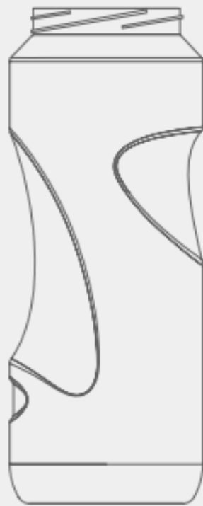
B2 – Seitenansicht