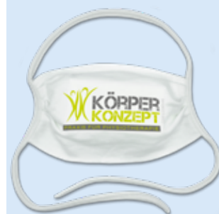
z.B. mit Firmenlogo