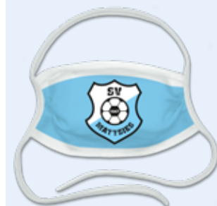
z.B. mit Vereinslogo