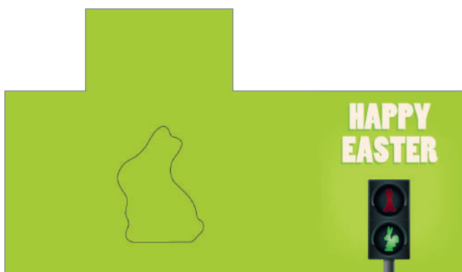
213627 – Hasen Ampel