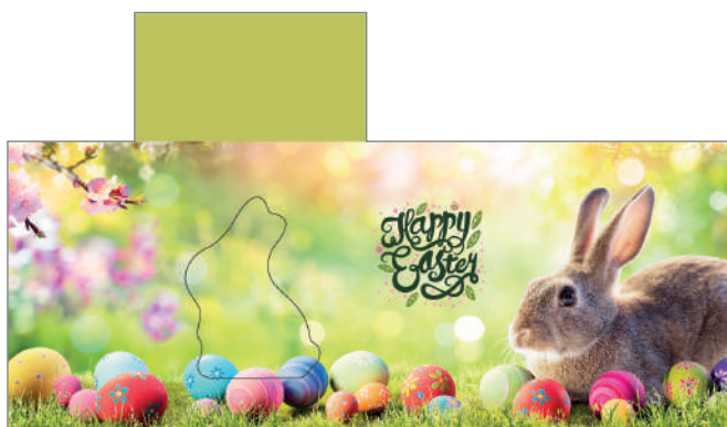
213625 – Frühlingsgefühle