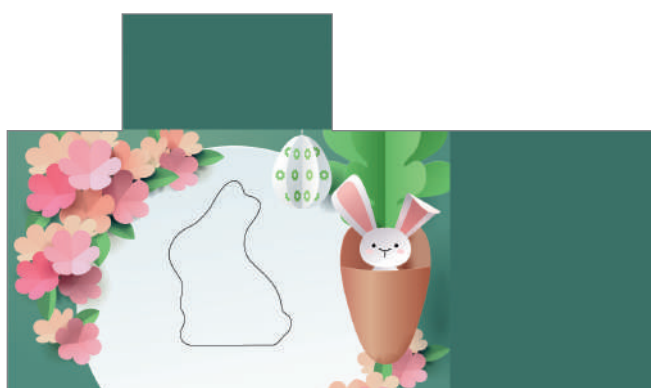
213630 – Blumige Ostern