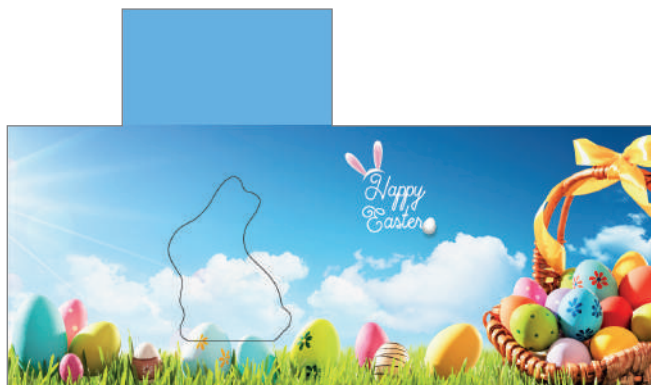
213624 – Sunny Easter