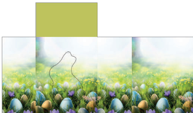
213623 – Ostergarten

2. Dein Logo, dein Text oder dein Bild wie gewünscht platzieren, evtl. das Motiv farblich verändern. Fertig!