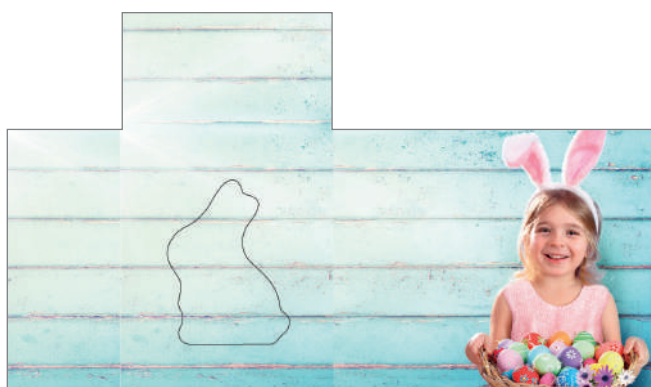
213628 – Sweet Easter